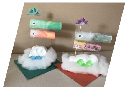
「マブリング 立体こいのぼり」