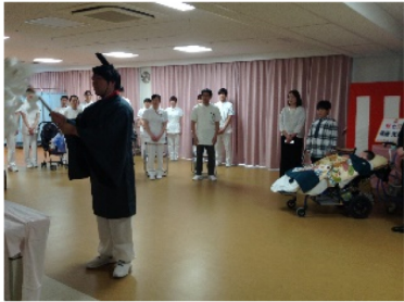
『みんなで♪あしたははれる♪を歌いました』